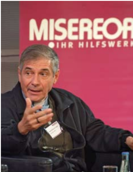
Bischof Dom Luiz Cappio, Brasilien.