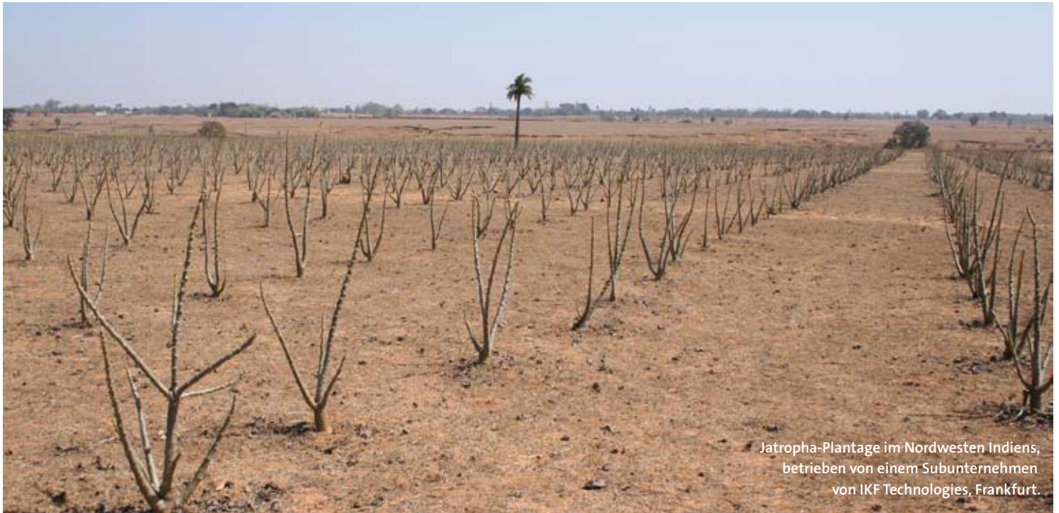
Jatropha-Plantage im Nordwesten Indiens, betrieben von einem Subunternehmen von IKF Technologies, Frankfurt.