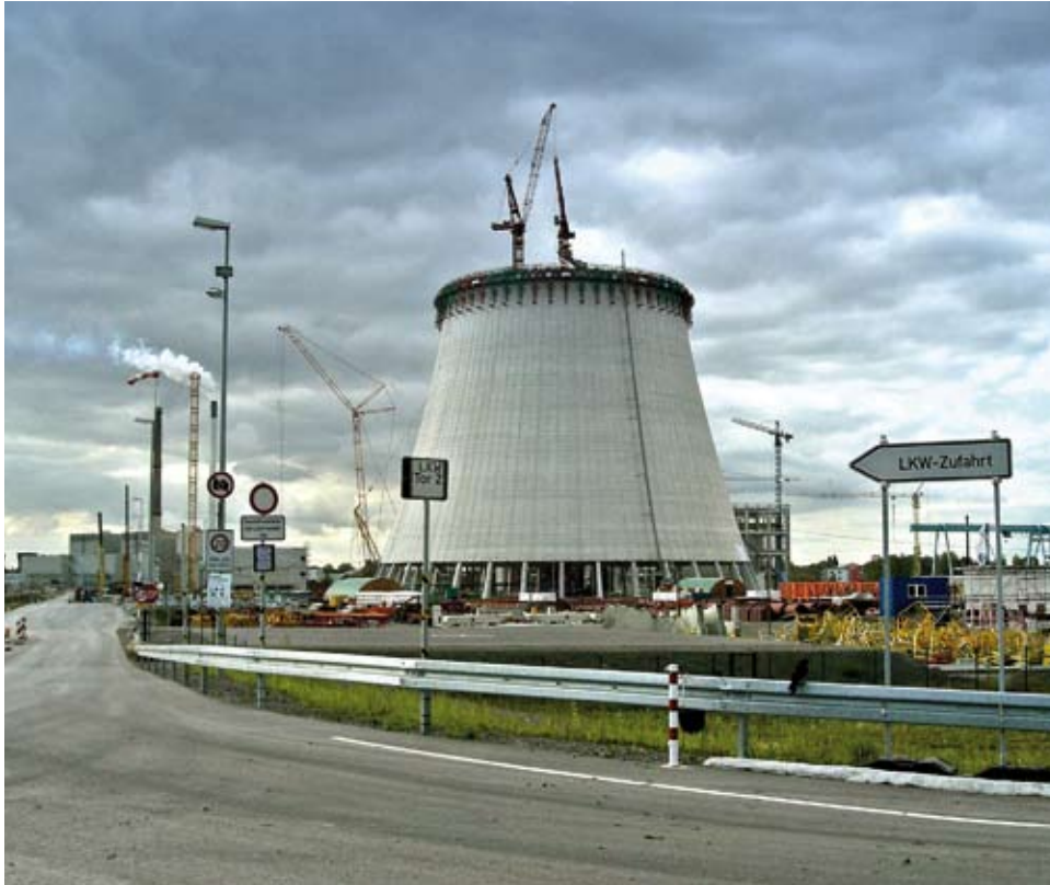
Der zur Hälfte fertige Kühlturm des neuen Kohlekraftwerkes in Datteln. Umweltschützer haben im September 2009 einen Baustopp erzwungen.

Kohle, Erdöl und Erdgas die Hauptursache für das Erwärmen der Erdatmosphäre ist. Dieser Klimawandel betrifft uns alle, jedoch die Armen im Süden zuerst und besonders heftig.