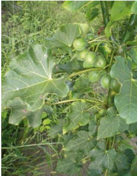
Die Frucht der Jatropha-Pflanze schmeckt nussig, ist jedoch giftig.

zungen von Jatropha in Kooperation mit der Daimler AG durchgeführt. Bereits 2006 gab es bekannt, dass in der viermonatigen Trockenzeit jede Pflanze mit etwa 100 Litern bewässert werden muss – 250.000 Liter wertvolles Wasser pro Hektar. Der hohe Wasserverbrauch wird durch eine aktuelle Untersuchung der Universität Enschede bestätigt. Demnach ist der Wasser-Fußabdruck von Jatropha, verglichen mit 12 weiteren Agrartreibstoff-Pflanzen, am größten.